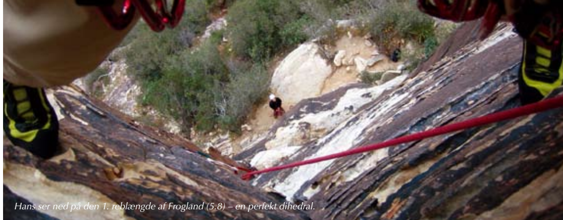
Hans ser ned på den 1. reblængde af Frogland (5.8) – en perfekt dihedral.

sikker at placere udstyr i, så vi beslutter os for at kaste os ud i nogle af de traditionelle multi-pitch ruter. Samtidigt beslutter vi os for at flytte ud af Las Vegas og tættere på Red Rocks (der ligger ca. 25 km vest for byen) til det eneste motel i nærheden af klippen: Bonnie Springs Motel, der er opbygget som en rigtig westernby med egen mini-zoo og togbane. Superhyggeligt sted der kan anbefales til folk der holder mere af at vågne op med udsigt til klipper end til neon-oplyste gambling hoteller! Alternativt er der en campingplads lige udenfor indgangen til parken.